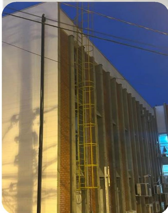
FOTO 6: Escada marinho instalado no prédio de Salas de Aula FE/FEM.