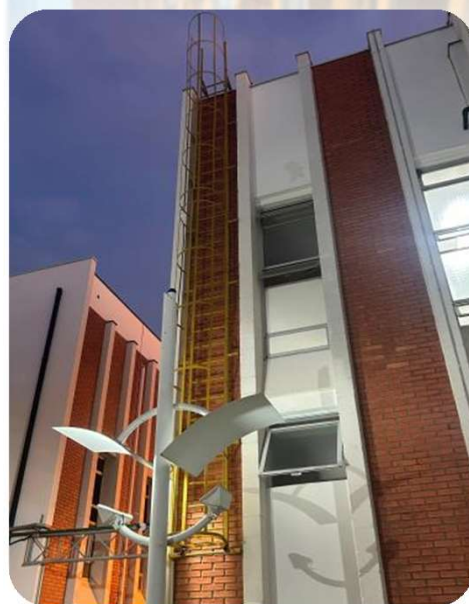
FOTO 2: Escada marinheiro instalado no prédio de Professores do DEA/DETA.