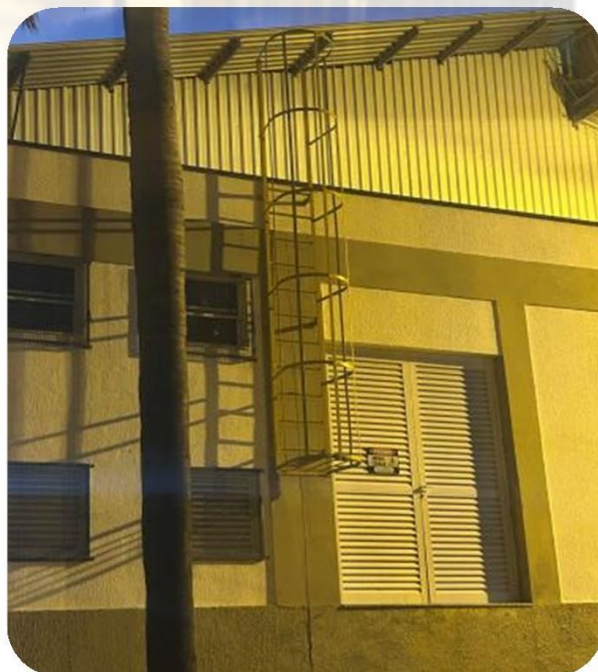
FOTO 7: Escada marinheiro instalado na cabine de energia do DTA/DETA.

SERVIÇO: Contratação de empresa para fornecimento e instalação de escada tipo marinheiros nos prédios da FEA EMPRESA: Carlos Jair Lagranha ELAB. POR: Eng°. Fábio Pancotti Morente - ENGENHARIA E MANUTENÇÃO FEA CONCLUÍDO: 02/03/2025