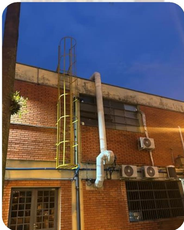
FOTO 3: Escada marinheiro instalado no prédio da Planta Piloto do DEA/DETA.

SERVIÇO: Contratação de empresa para fornecimento e instalação de escada tipo marinheiros nos prédios da FEA EMPRESA: Carlos Jair Lagranha ELAB. POR: Eng°. Fábio Pancotti Morente - ENGENHARIA E MANUTENÇÃO FEA CONCLUÍDO: 02/03/2025