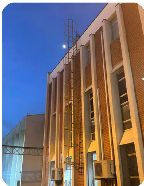
FOTO 1: Escada marinheiro instalado no prédio da Administração da FEA.

Contratação de empresa para fornecimento e instalação de escadas tipo marinheiro nos prédios da FEA, com o objetivo de garantir acesso seguro às coberturas para realização de manutenções preventivas e corretivas em equipamentos instalados na parte superior das edificações. A instalação dessas escadas é fundamental para assegurar a segurança dos técnicos e funcionários durante os trabalhos em altura, atendendo às normas de segurança e reduzindo riscos de acidentes. Ao todo, foram instaladas 13 escadas distribuídas em diferentes pontos estratégicos dos prédios da FEA. Abaixo, seguem fotos de algumas das escadas instaladas.